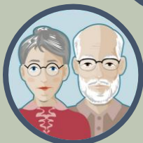
Les parents d'un détenu