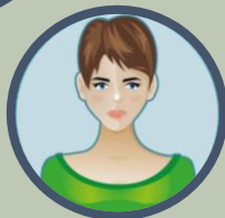
Le conjoint d'un détenu

Tous sont des condamnés par ricochet qui n'ont pourtant commis aucune infraction